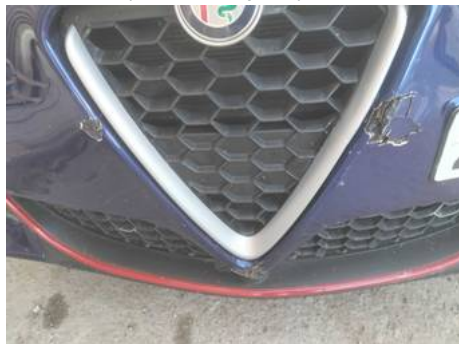
Calandre (Défaut aspect)